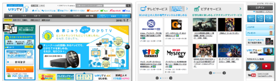
(図 1) NTTぷらら「ひかりTV」

さらなる会員獲得のため新しいメディアを模索する中、認知を獲得につなげるメディアとして YouTube TrueView インストリーム広告（以下 TrueView）を選択しました。TrueView でセッション数を増やし認知度を上げながら、他オンライン メディアも含めた全体の会員獲得数を拡大することが目的です。施策の結果、Google アナリティクスを用いて TrueView のコンバージョンへの間接的効果を実証することにも成功しました。