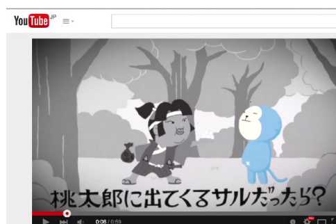
(図 2) YouTube TrueView インストリーム広告「ひかりカエサル 「もしも、ひかりカエサルが桃太郎のサルだったら？どーなると思う？」

訴求クリエイティブとして、サービス キャラクターを使った本キャンペーン用 TrueView 広告「もしも、ひかりカエサルが桃太郎のサルだったら？どーなると思う？」を作成。動画広告の利点を活かし、ひかりTV の番組や映画など、映像コンテンツの魅力をダイレクトに訴える内容にしました(図 2 参照)。